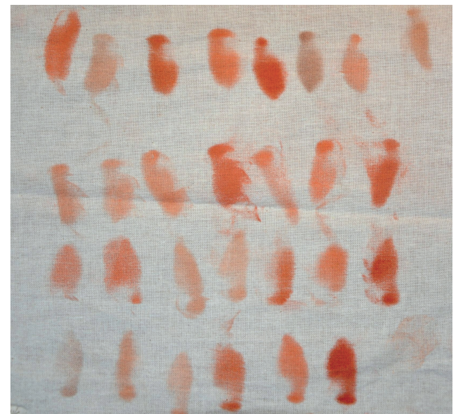
Afsmitningsprøver. Overfladerne udviser varierende afsmitning som udtryk for nedbrydningen og tilsmudsning af malingen. Her ses også de store farveforskelle på malingerne.

Fugtmålinger udført gennem årene viser, at facaden er fin og tør på alle felter. Det skaber de bedste forudsætninger for at sammenligne de forskellige behandlingsopbygninger og malinger.